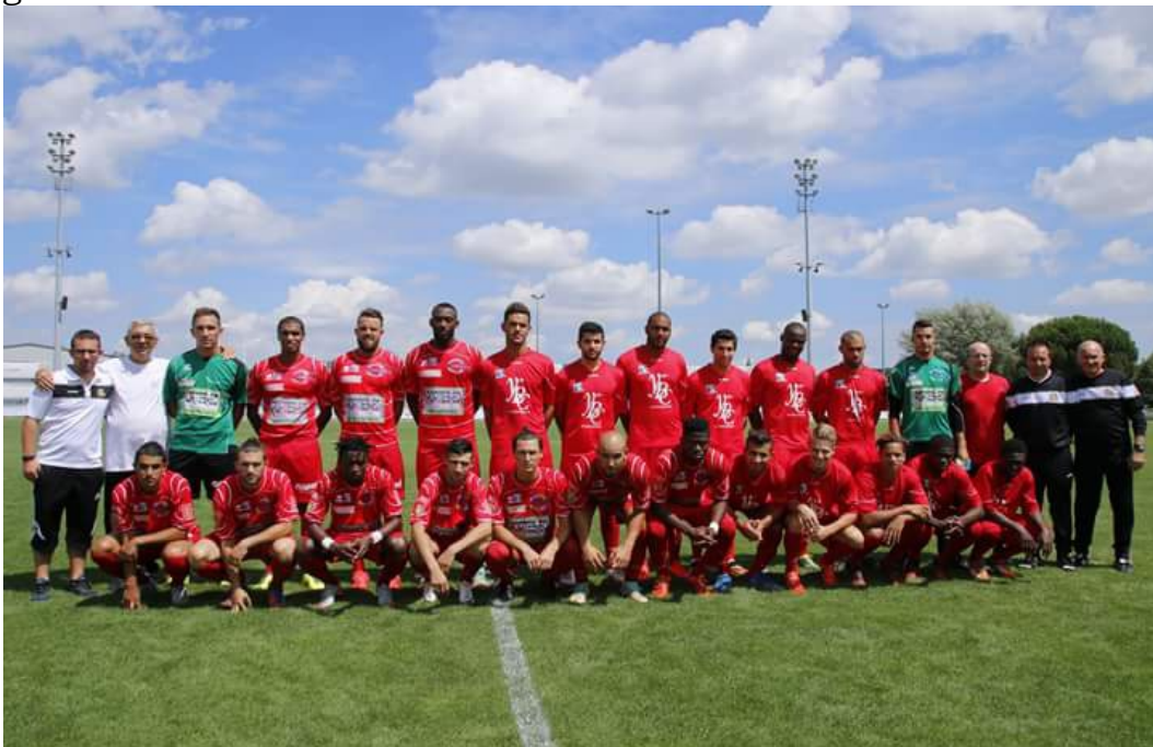
L'équipe Seniors qui évolue en CFA 2

A ce jour, 27 équipes, dont 2 féminines, constituent le club composé de 480 joueurs et 80 dirigeants.