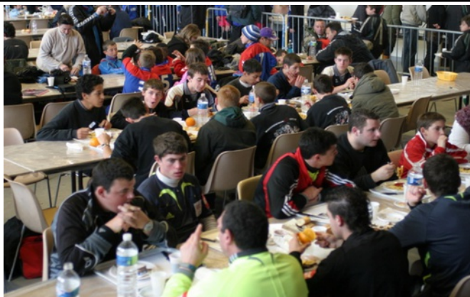
Restauration sur place