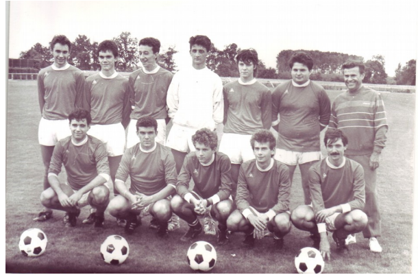
Saison : 1987-1988