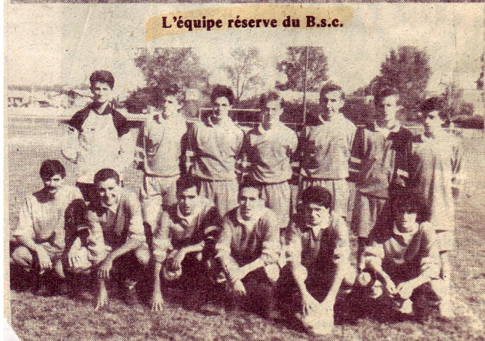
L'équipe réserve du B.S.C.