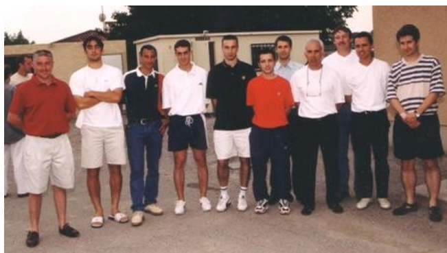
02 : présentation des aux joueurs