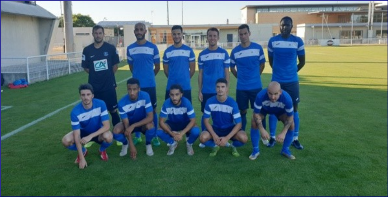
Blagnac n'aura pu empêcher la défaite.