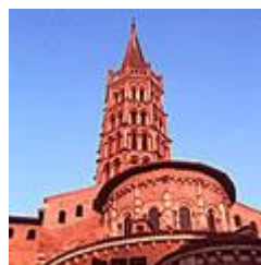
la basilique Saint-Sernin