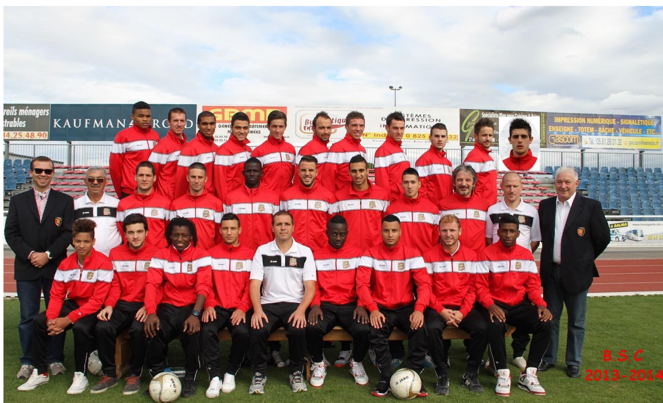
L'équipe Seniors qui évolue en CFA 2

A ce jour, 26 équipes constituent le club composé de 480 joueurs et 80 dirigeants.