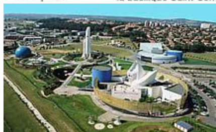
La cité de l'espace