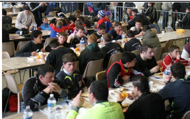
Restauration sur place